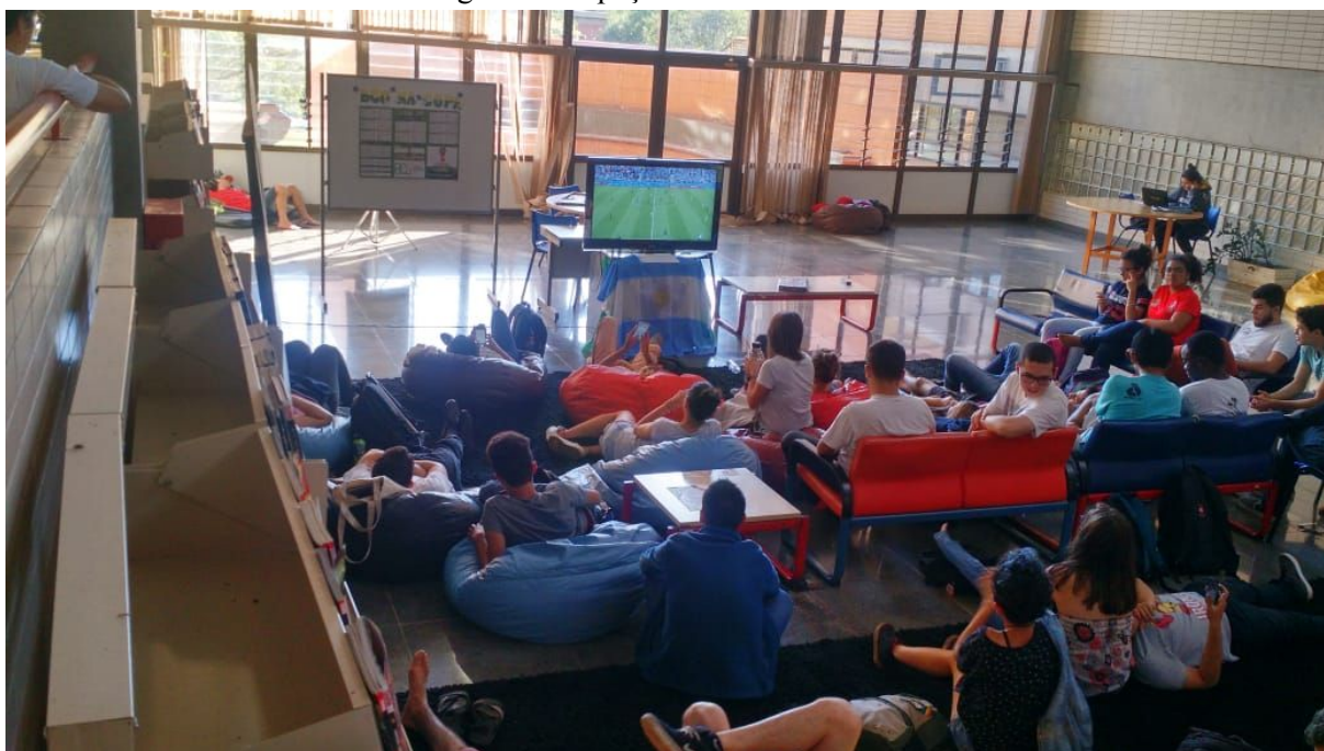
Figura 1 - Espaço de convivência