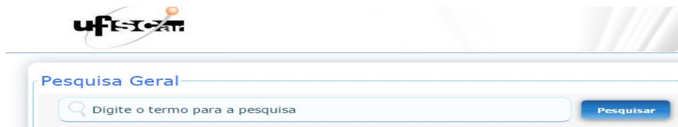
Figura 1 - Caixa de busca para Pesquisa Geral do Pergamum