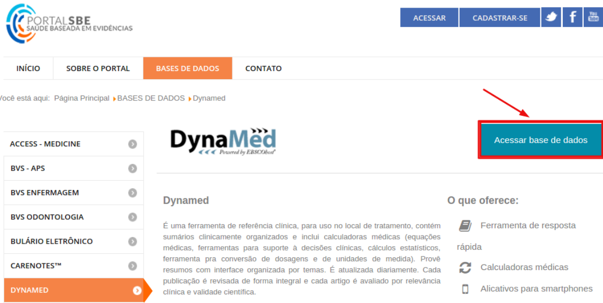
Figura 4: Dynamed - acessar base

Abrirá uma janela do Sistema Sabiá, clique em “Fazer Login” (Figura 5).