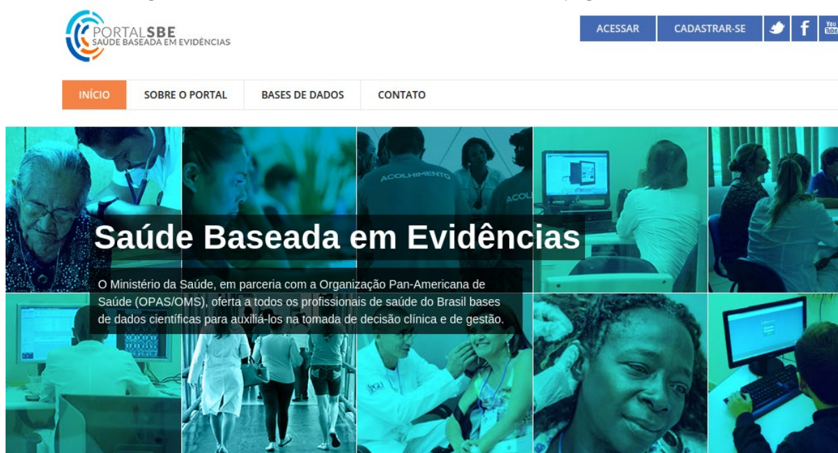
Figura 1: Portal da Saúde Baseada em Evidências - página inicial

Em seguida, posicione o cursor sobre a aba “Base de Dados” (Figura 2).