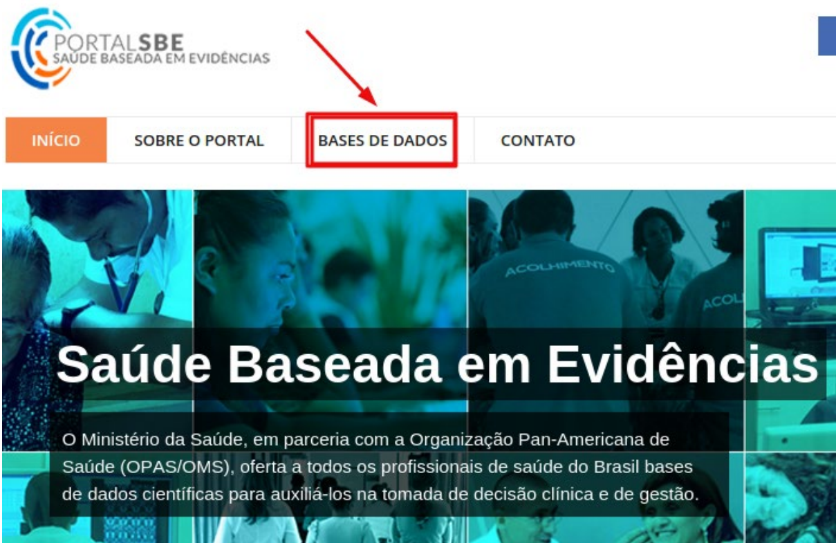
Figura 2: Portal da Saúde Baseada em Evidências - Bases de Dados